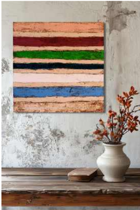
Termine Tecnica mista su tela 50x50 cm