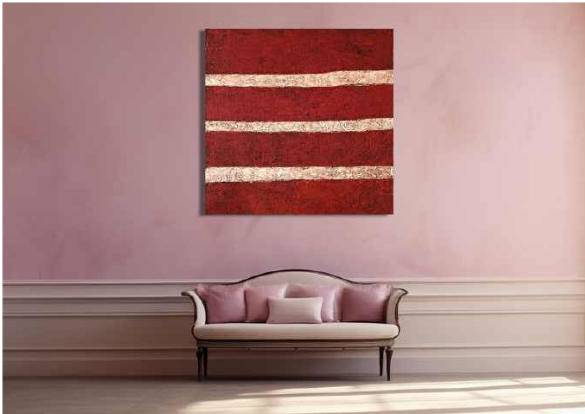
Notizie da El Dorado Tecnica mista su tela 100 x 100 cm