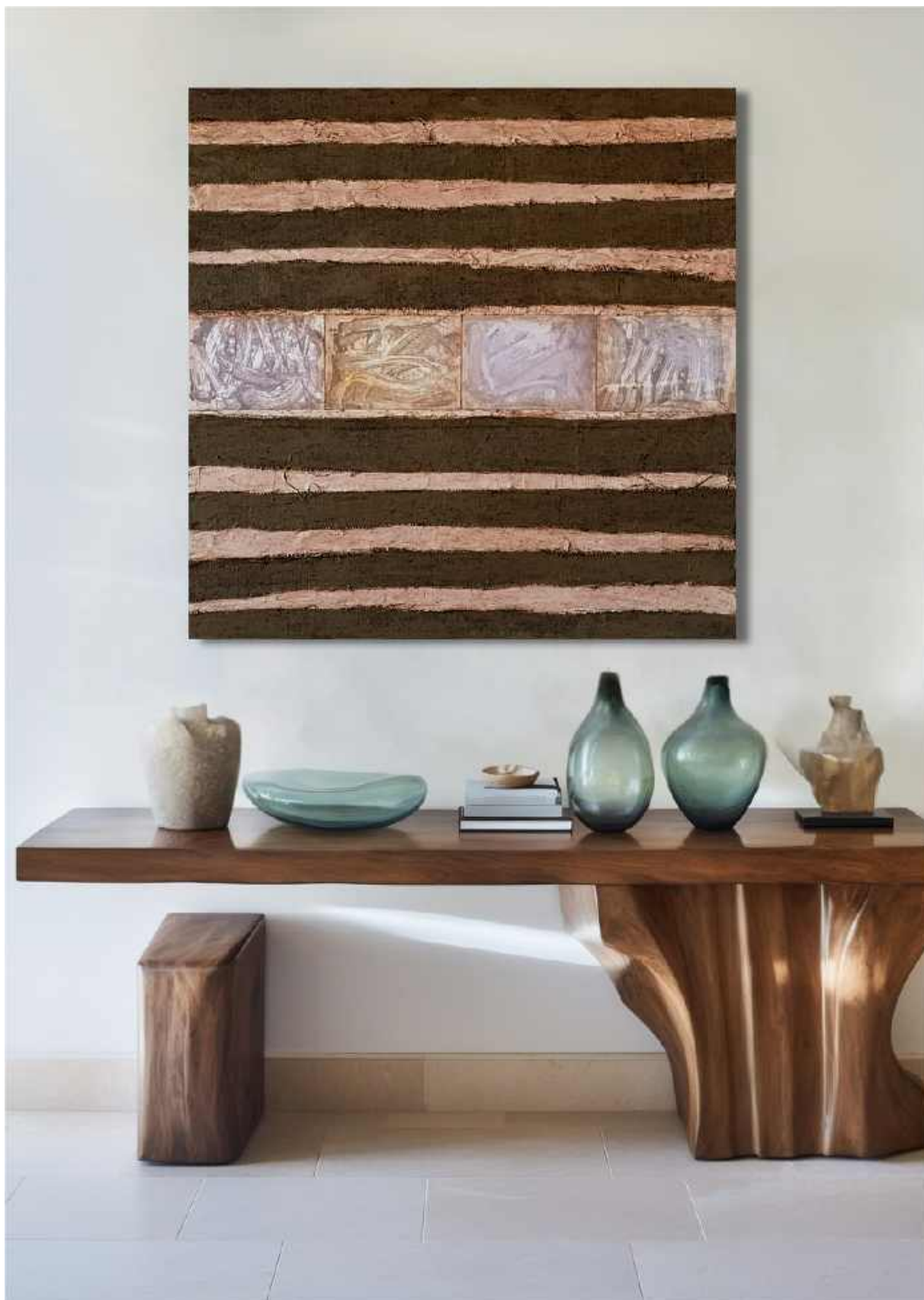
Diapositive di un sogno Tecnica mista su tela 80 x 80 cm