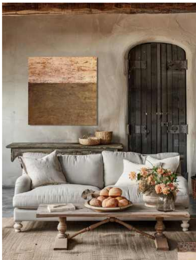
Pampa Tecnica mista su tela 100 x 100 cm