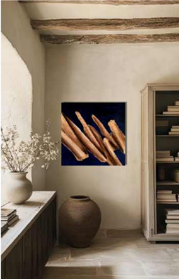
Azul Tecnica mista su tela 70 x 70 cm