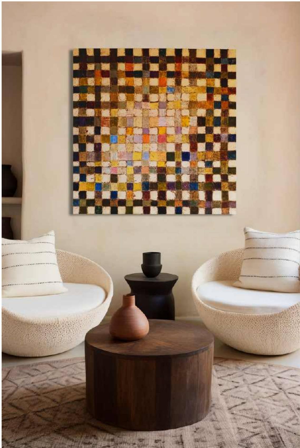
O sole mio Tecnica mista su tela 100 x 100 cm