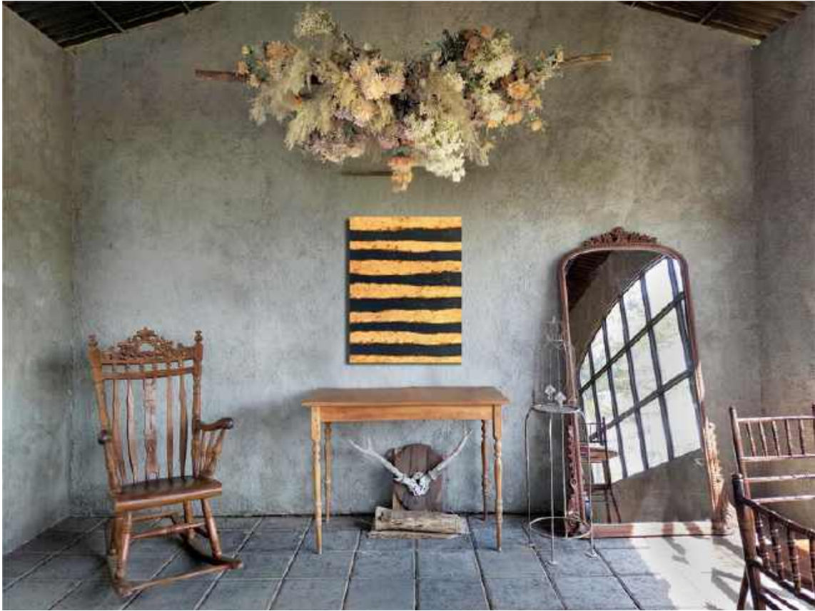
Salita in blu Tecnica mista su tela 60 x 40 cm