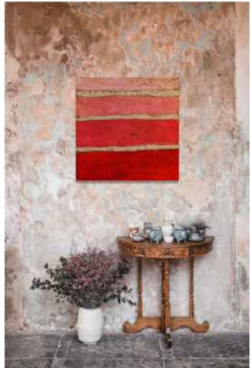
Claro di luna in rosso Tecnica mista su tela 50 x 50 cm