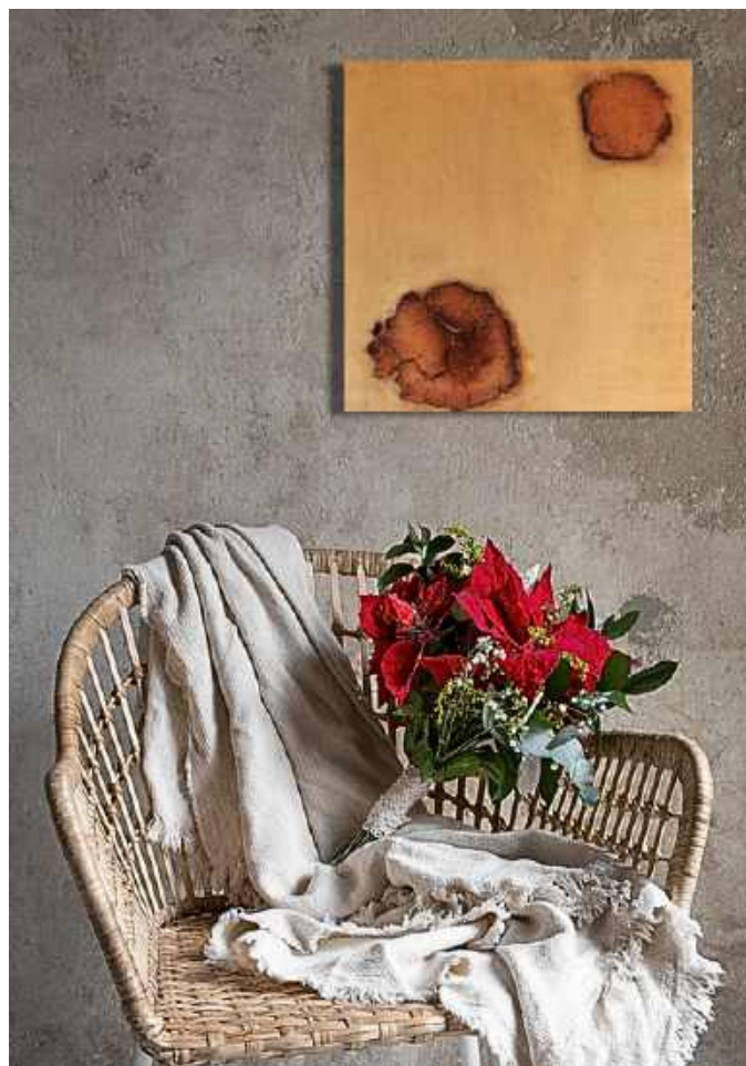
Terra e legno Tecnica mista su tela 50 x 50 cm