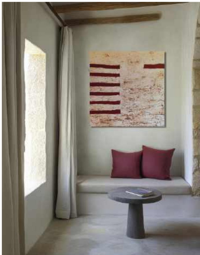
Gondola Tecnica mista su tela 80 x 80 cm