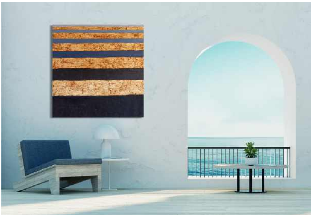
Azzurro in lontananza Tecnica mista su tela 100 x 100 cm