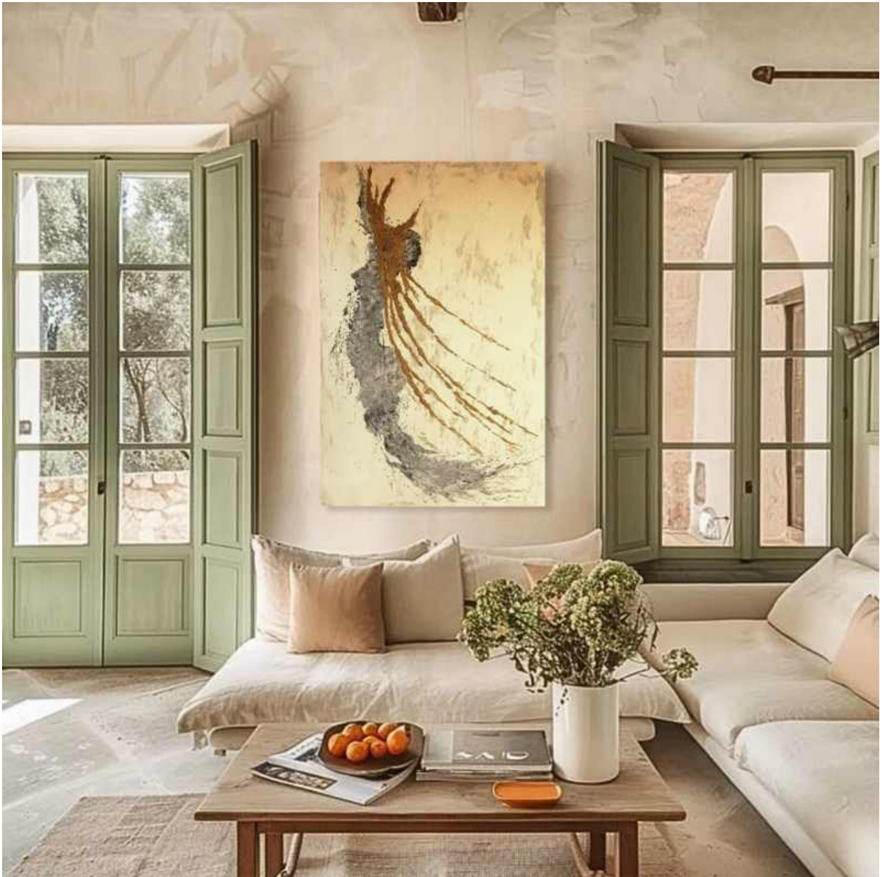
Nascita di una vite Tecnica mista su tela 5120 x 80 cm