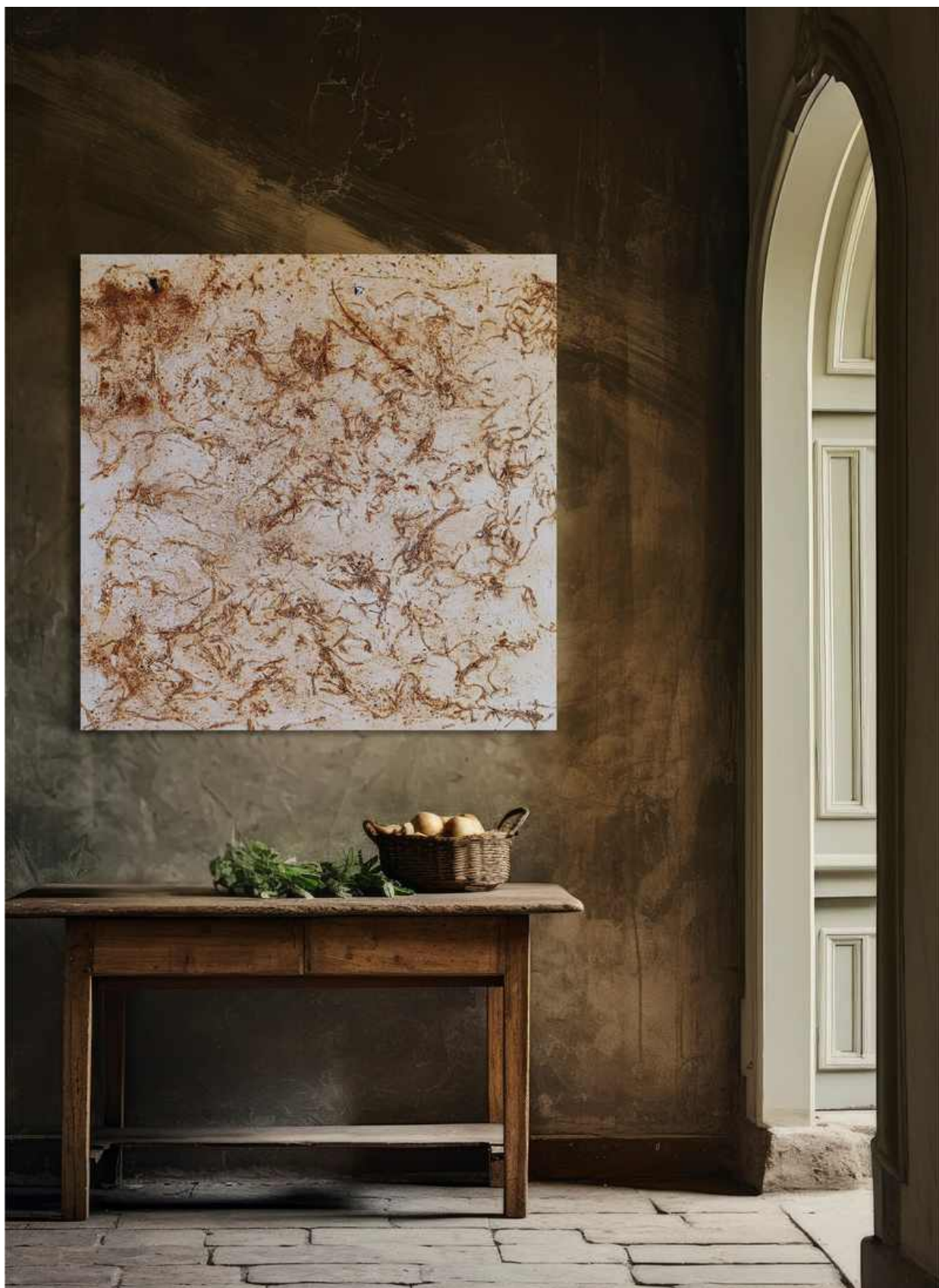
Impronte d'atelier. Tecnica mista su tela 80 x 80 cm