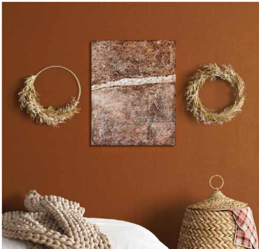
Spacco Tecnica mista su tela 60x40 cm