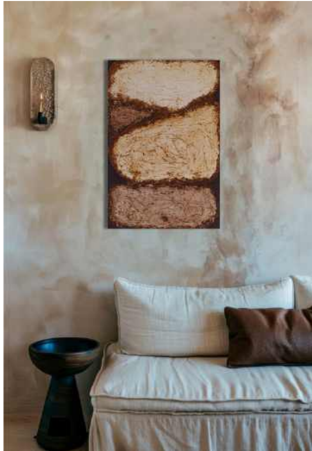
Paesaggio Tecnica mista su tela 60x40 cm