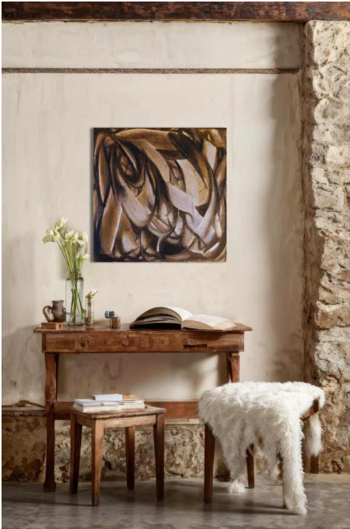
Une coppa Tecnica mista su tela 50 x 50 cm