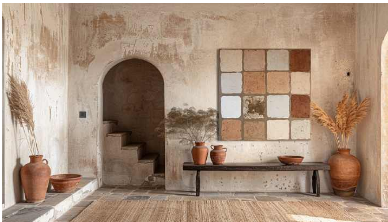
Materia Tecnica mista su tela 80 x 80 cm