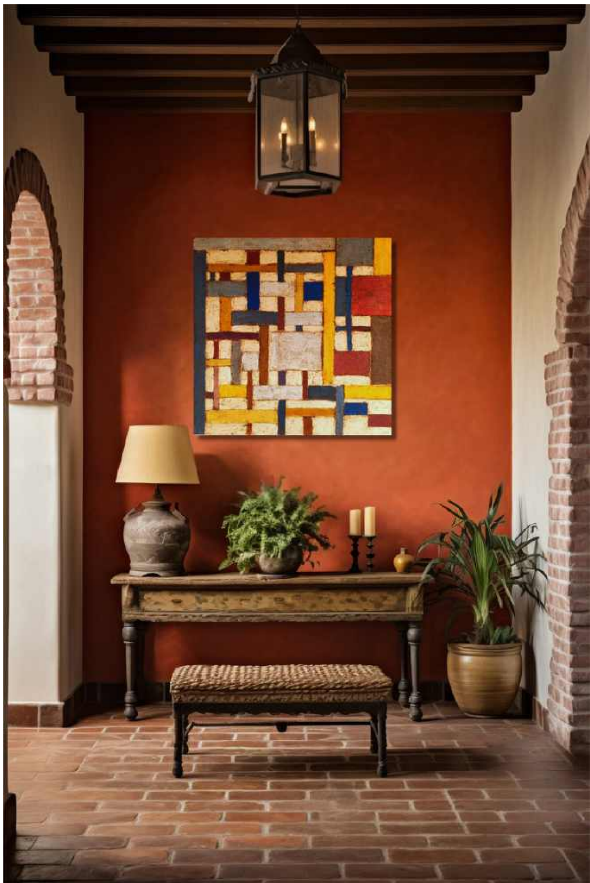
Composizione geometrica Tecnica mista su tela 100 x 100 cm