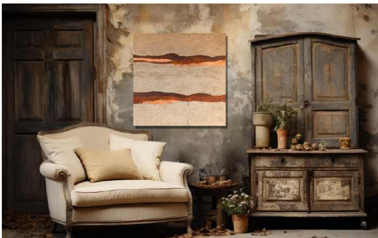
Grigio collinare Tecnica mista su tela 80 x 80 cm