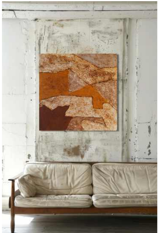
Sentiero Tecnica mista su tela 100 x 100 cm