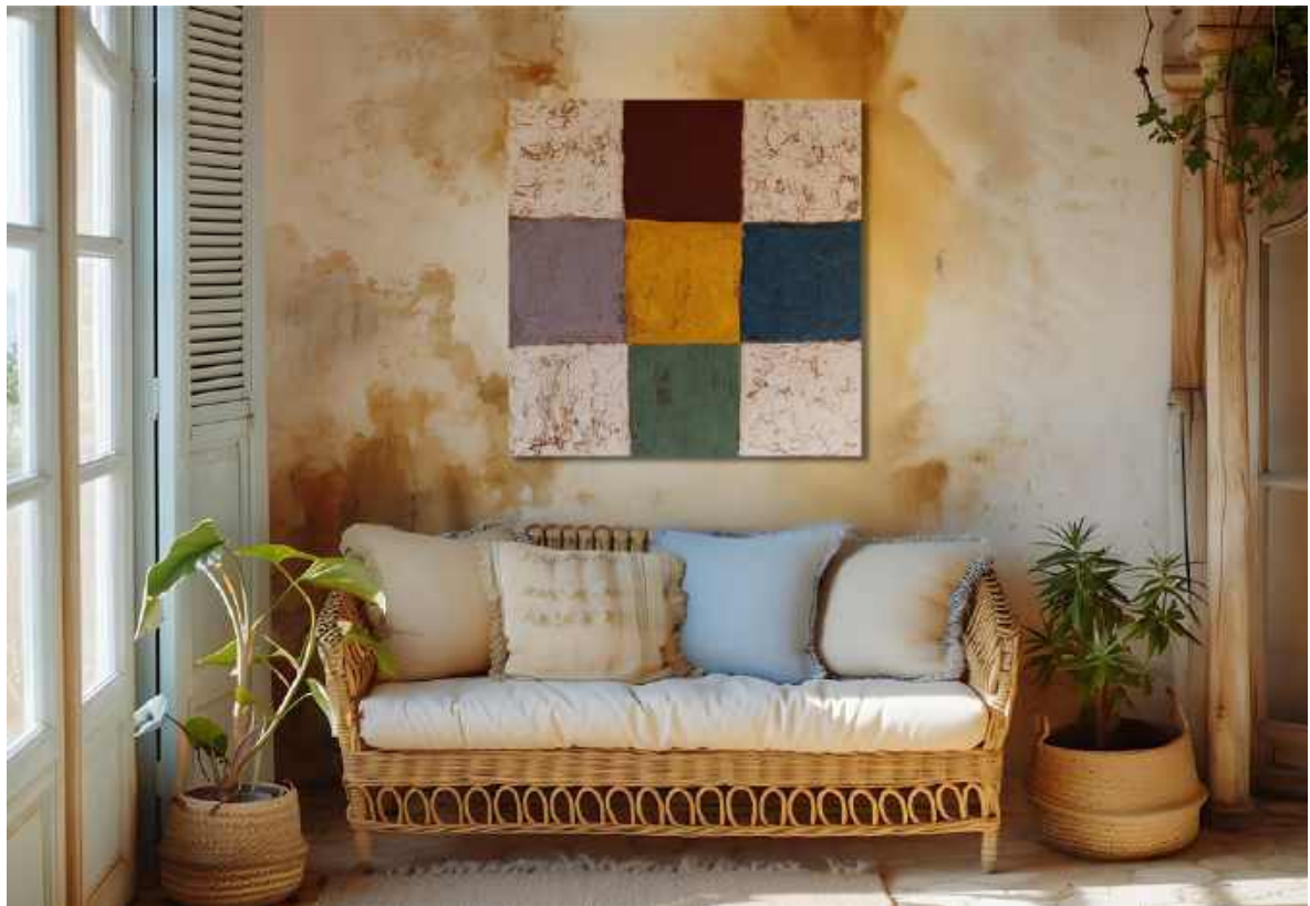
Cinque colori Tecnica mista su tela 70 x 70 cm