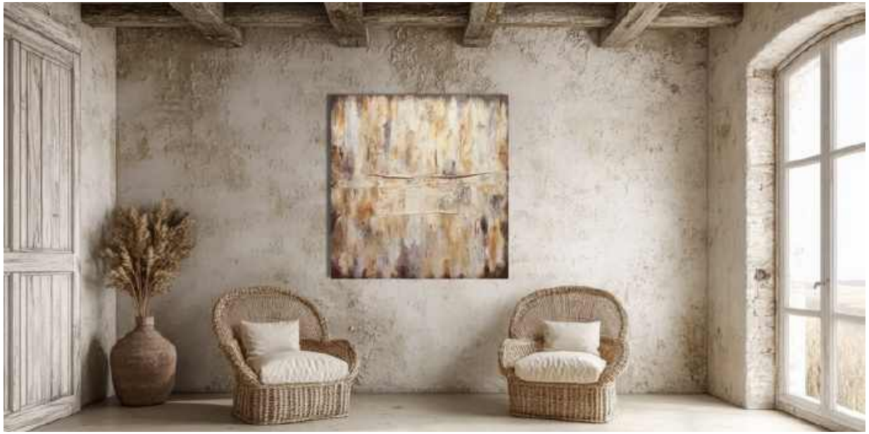
Cicatrici Tecnica mista su tela 100 x 100 cm