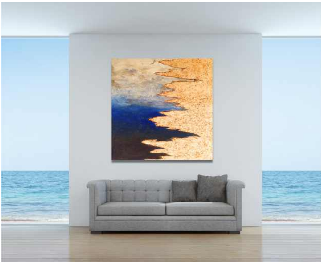
Dietro le montagne, la luce Tecnica mista su tela 80 x 80 cm