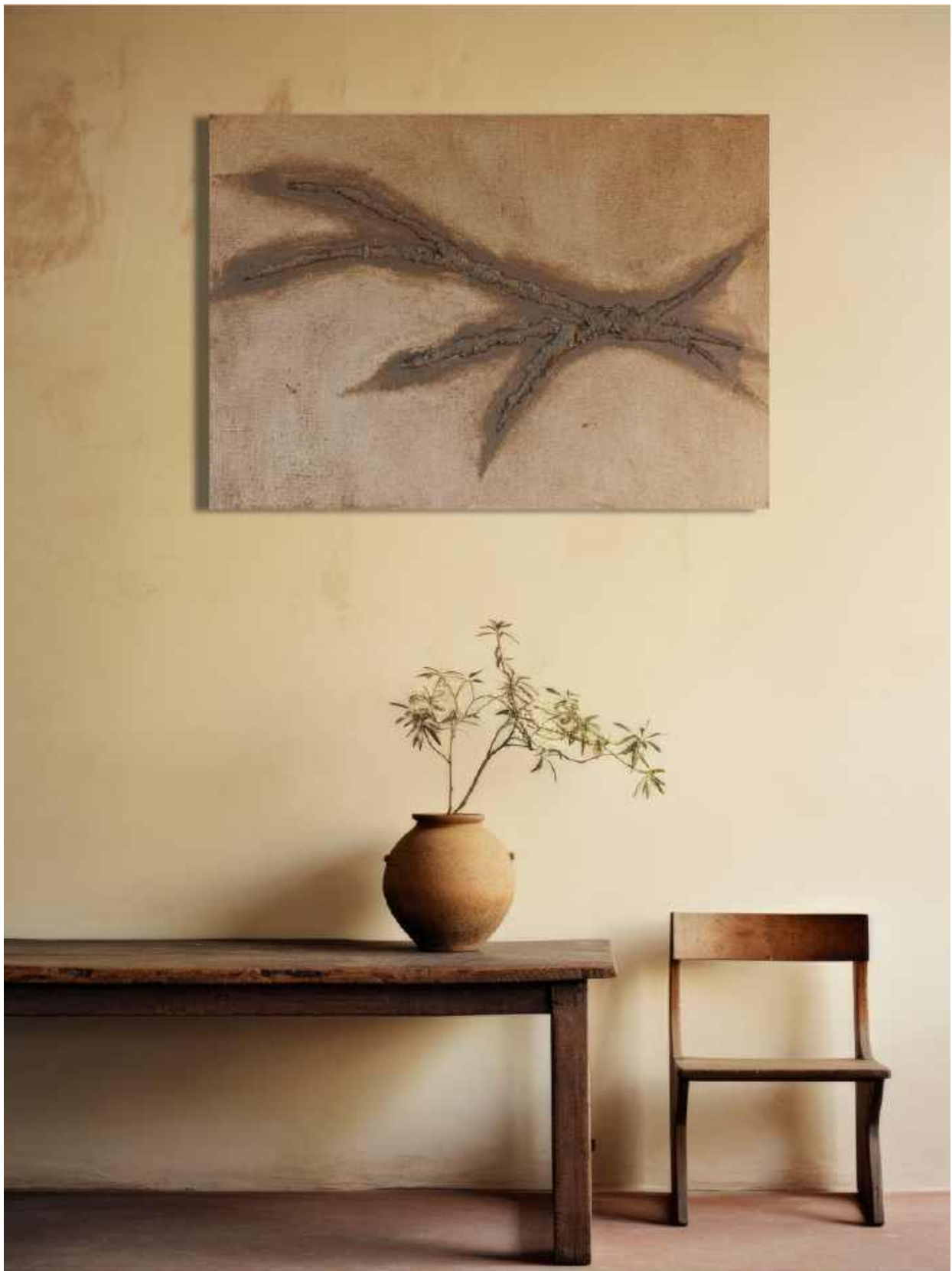
Incrocio collinare Tecnica mista su tela 50 x 70 cm