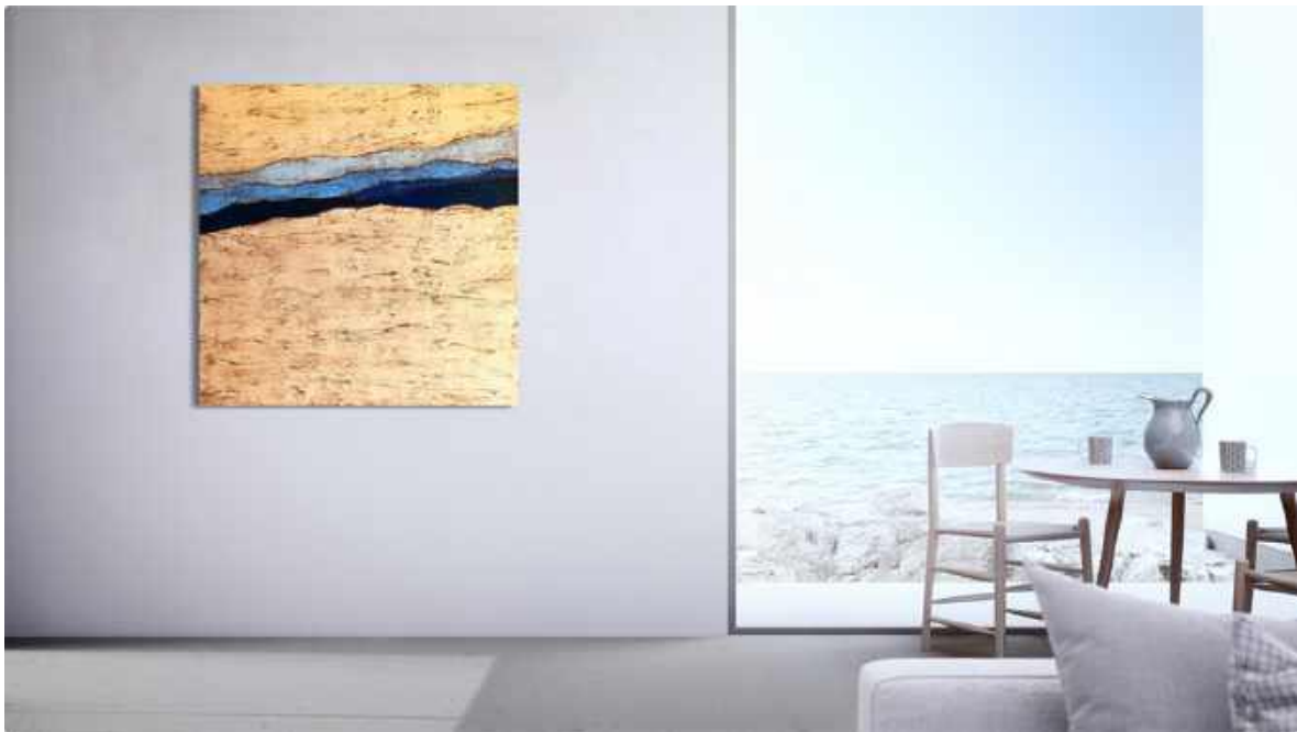
Colline de Gavi en blu Tecnica mista su tela 80 x 80 cm