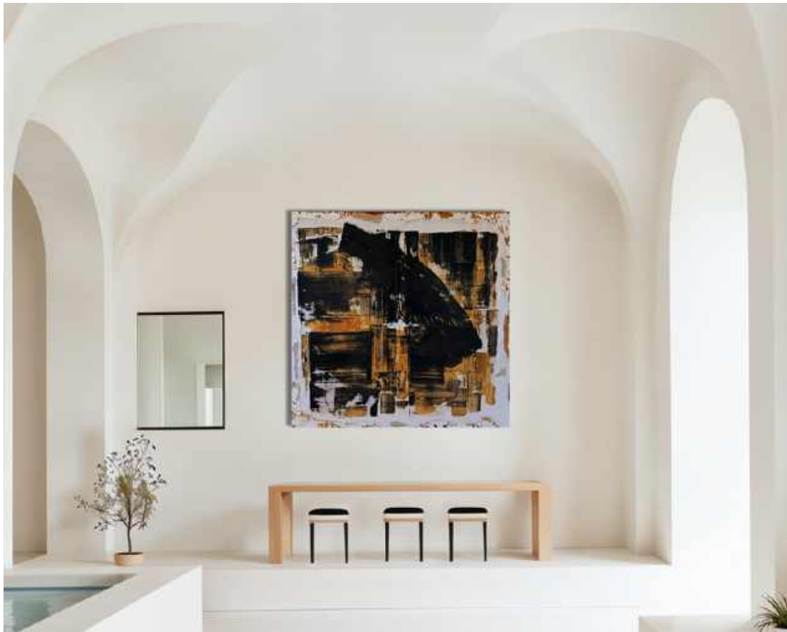
Una croce Tecnica mista su tela 100 x 100 cm