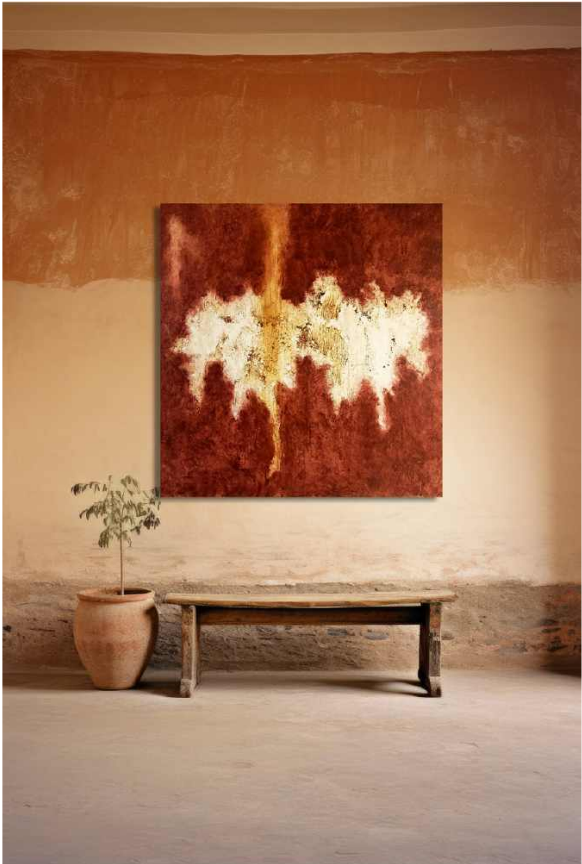
Grappoli Tecnica mista su tela 100 x 100 cm